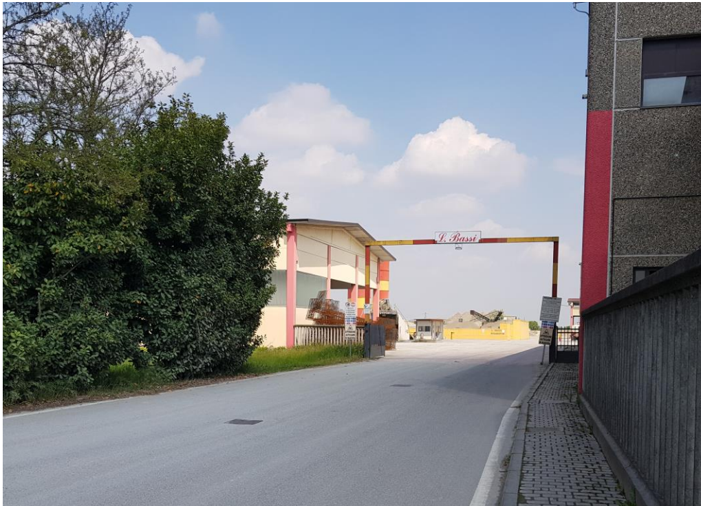
Fotografia n.4 – Vista Ingresso

Via Corniani, 40 25034 Orzinuovi (BS) Tel. e Fax. 030 9941046 Cell.3356453499 Mail. ing.toninelli@gmail.com PEC. giuseppe.toninelli@ingpec.eu C.F. TNNGPP64M23G149S P.IVA 03827050984