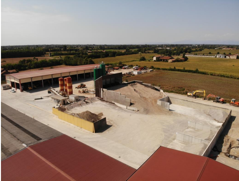
Fotografia n.3 – Vista aerea

Via Corniani, 40 25034 Orzinuovi (BS) Tel. e Fax. 030 9941046 Cell.3356453499 Mail. ing.toninelli@gmail.com PEC. giuseppe.toninelli@ingpec.eu C.F. TNNGPP64M23G149S P.IVA 03827050984