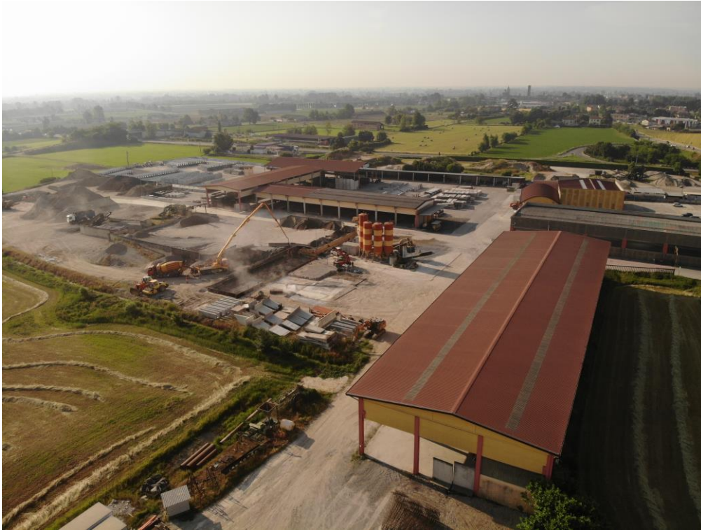
Fotografia n.1 - Vista aerea

Via Corniani, 40 25034 Orzinuovi (BS) Tel. e Fax. 030 9941046 Cell.3356453499 Mail. ing.toninelli@gmail.com PEC. giuseppe.toninelli@ingpec.eu C.F. TNNGPP64M23G149S P.IVA 03827050984