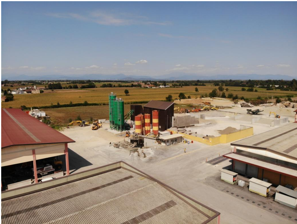
Fotografia n.2 - Vista aerea